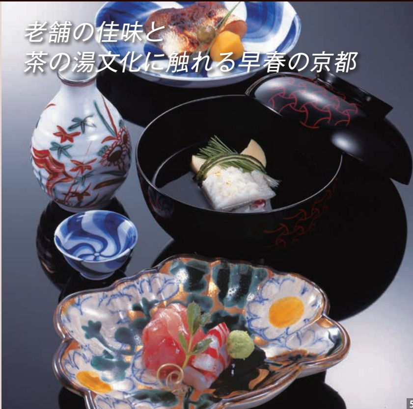
4 八坂神社の表参道に立ち、田楽豆腐発祥の店として知られる「二軒茶屋 中村楼」。5 古くより“茶の湯の宿”として名をはせた「京都 炭屋旅館」。芸術の域にまで昇華したといわれる、五感を刺激する絶品の懐石料理を堪能したい。